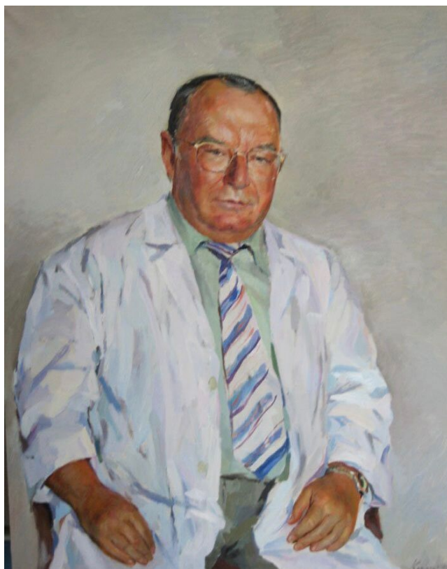
Борис Клементьев. «Портрет М. М. Абакумова»