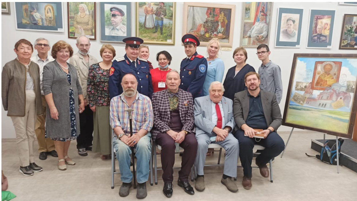
Авторы выставки, академики и гости

В Московском отделении ПАНИ ни на один день не прерывалась работа в летние каникулы, на которые члены академии, разумеется, имеют право. Однако запланированные проекты должны реализовываться, несмотря на сложности, а может быть, и вопреки им. Тем более мы - в преддверии 11-го съезда ПАНИ. Он состоится 22 октября в Санкт-Петербурге, в здании Российского государственного педагогического университета имени А.И. Герцена. От каждого регионального отделения будут участвовать по два делегата с правом решающего голоса. Могут быть на съезде и другие члены МО ПАНИ, но с правом совещательного голоса. Все желающие присоединятся к работе съезда в формате онлайн.